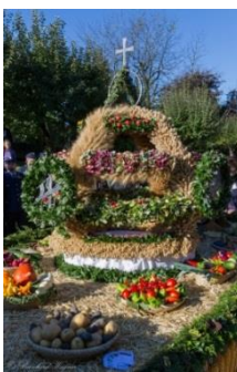
Erntekrone gestaltet von der Dorfgemeinschaft Lindhof und Dachberg.

Die Adventzeit ist auch eine Zeit der Buße und des Neu-Werdens. Ich möchte Sie einladen und ermutigen, sich durch den Empfang des Bußsakramentes auf die Ankunft Christi vorzubereiten. Nützen Sie bitte die Beichtgelegenheiten in der Pfarre oder auch auswärts, bei einer Wallfahrt, in der Kapuzinerkirche in Klagenfurt oder Wolfsberg, am Fatimatag (13. des Monates) und wo immer sich eine Gelegenheit ergibt..