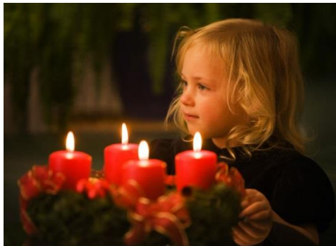
Foto Adventkranz

Advent, Advent, ein Lichtlein brennt, erst eins, dann zwei....