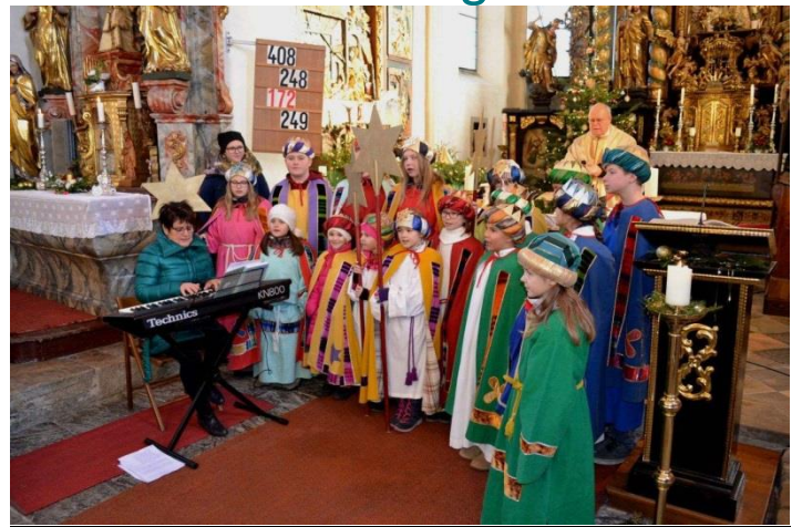
Sternsingergruppen Pfarre Ma. Rojach

Unsere Sternsinger bringen die weihnachtliche Friedensbotschaft zu Ihnen und besuchen Sie vom 27. bis 30. Dezember 2019 und ab 2. Jänner 2020 Bitte, nehmen Sie unsere Sternsinger gerne auf und unterstützen Sie mit Ihrer Spende Projekte in der 3. Welt. Helfen Sie den Ärmsten der Armen.