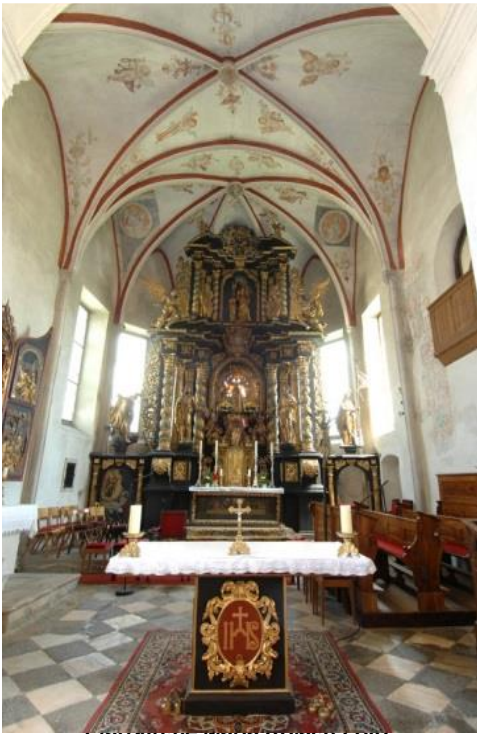
Pfarrkirche Maria Rojach